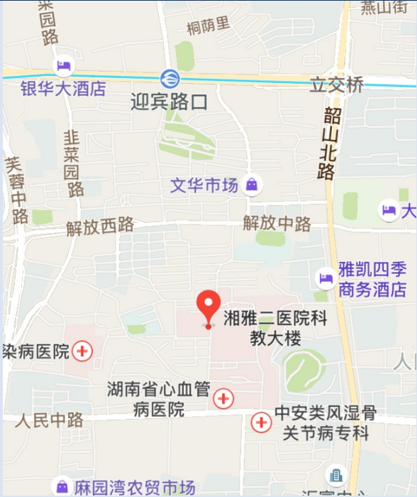
中南大学湘雅二医院科教大楼 位置图